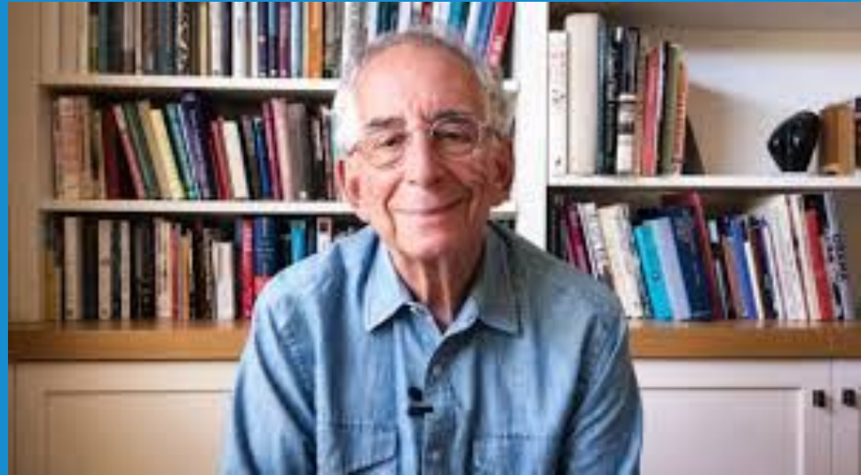
Barry Schwartz, Ph.D

Pourtant, nous nous sentons souvent PIRE.”