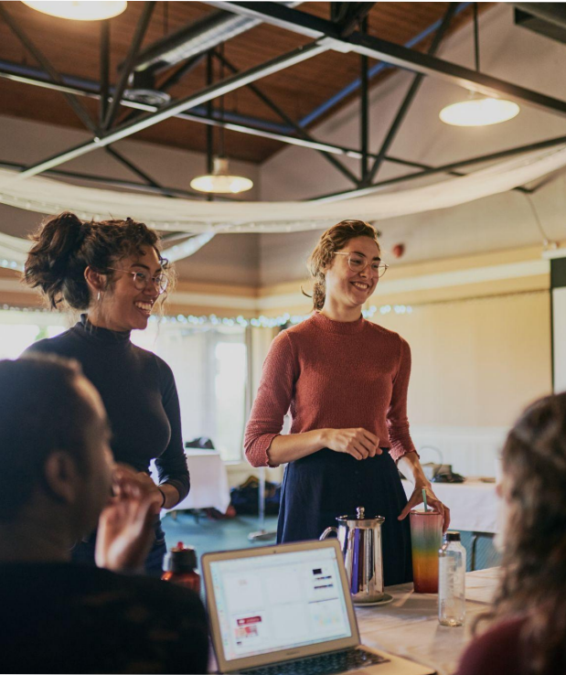
Ateliers compétences emploi, vie quotidienne et leadership