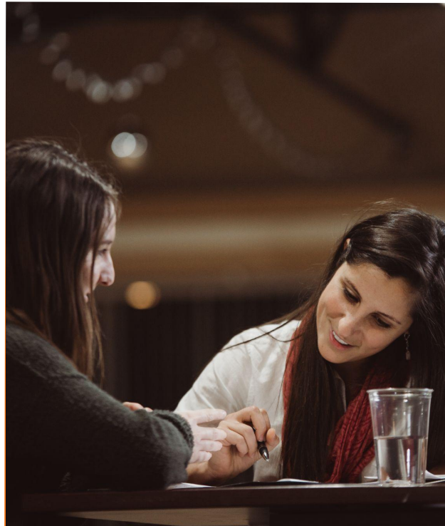
Coaching de carrière et de vie