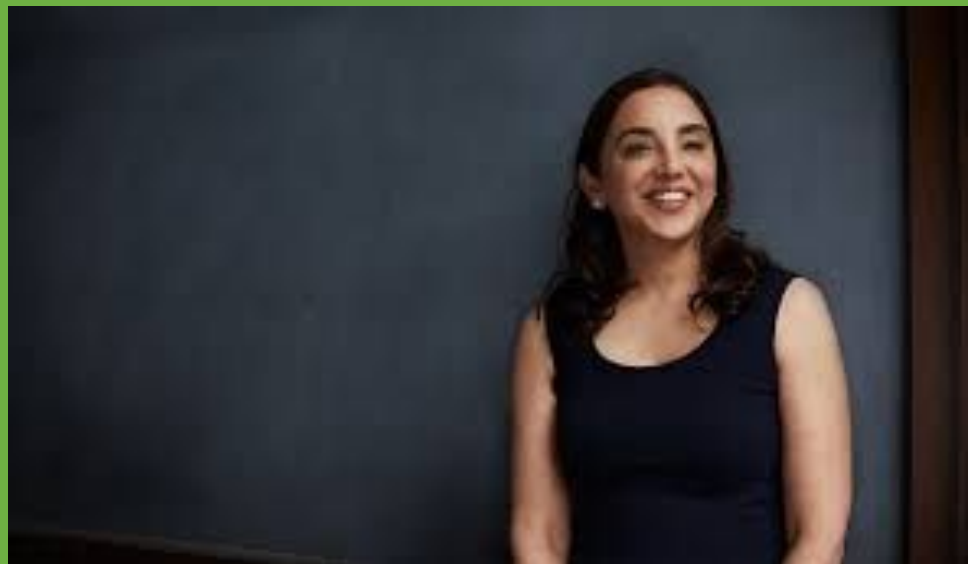
Sheena Iyengar, Ph.D

Plus de choix = plus probable de ne PAS CHOISIR