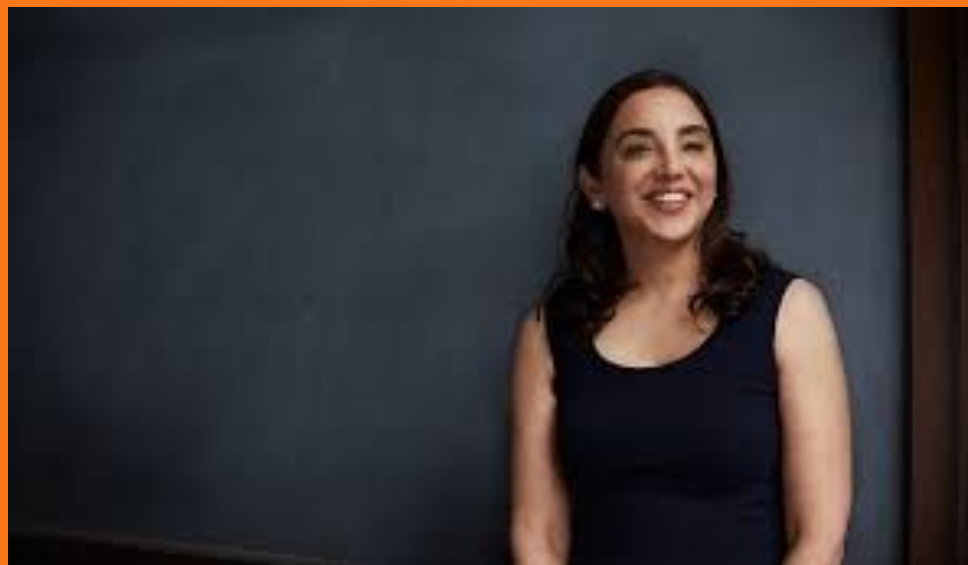
Sheena Iyengar, Ph.D

“Quand nous avons trop d'options, nous choisissons de ne pas choisir, même si cela va à l'encontre de notre intérêt.”